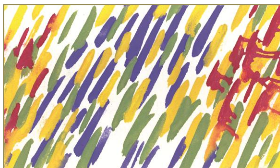
Figura 4. Linia și pata plastică ( mișcarea )