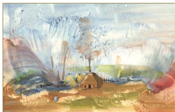
Figura 6. Monotipe ( interpretarea creativă plastică a petelor cromatice )

În concluzie , putem menționa faptul că problema dezvoltării gustului artistico-plastic la orele de educație plastică are o natură complexă, combinată cu nivelul dezvoltării percepției artistice a culorilor în realitate și artă. Totodată, percepția artistică a culorilor presupune o succesiune de exigențe, printre care s-au remarcat în analiza alăturată două: cunoștințele specifice , necesare în domeniul semanticii cromatice, și capacitățile de operare creativă cu culoarea . Astfel, în calitate de factor important și