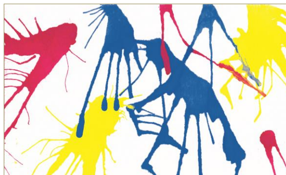
Figura 2. Tehnica stropire ( și petelor accidentale )