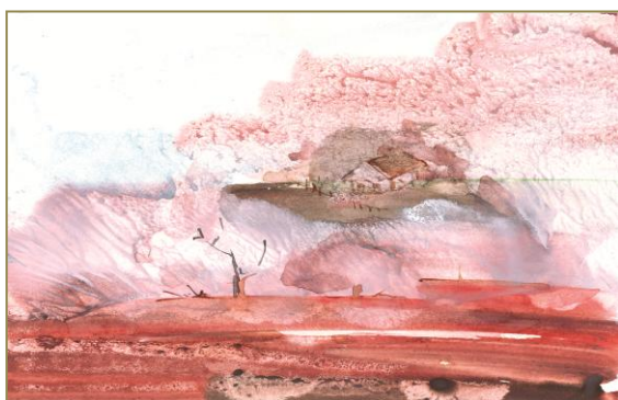
Figura 5. Monotipe ( interpretarea cromatică creativă plastică )