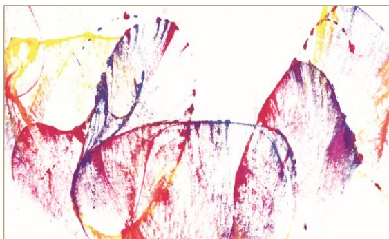
Figura 1. Tehnica monotipe ( prelucrare modulară cu ață )

În continuare, alăturăm, în calitate de exemplu, unele lucrări instructive creativ-plastice ale studenților – la compartimentul interpretării creative a culorilor –, efectuate prin utilizarea diferitelor tehnici grafice (Figurile 1-6).