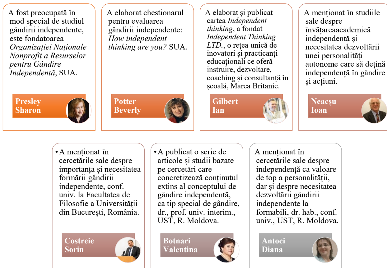
Figura 1. Baza epistemologică a conceptului de gândire independentă

Studierea rezultatelor științifice ale cercetătorilor enunțați mai sus ne permit a esențializa unele caracteristici ale gânditorului independent or, gândirea independentă reprezintă un tip de gândire care nu este întotdeauna ușoară, deoarece necesită eforturi intelectuale și implică asumarea unor riscuri precum: să fii nepopular, să mergi împotriva majorității, să fii privit diferit sau necooperant, să pari egoist, să fii ignorat etc.