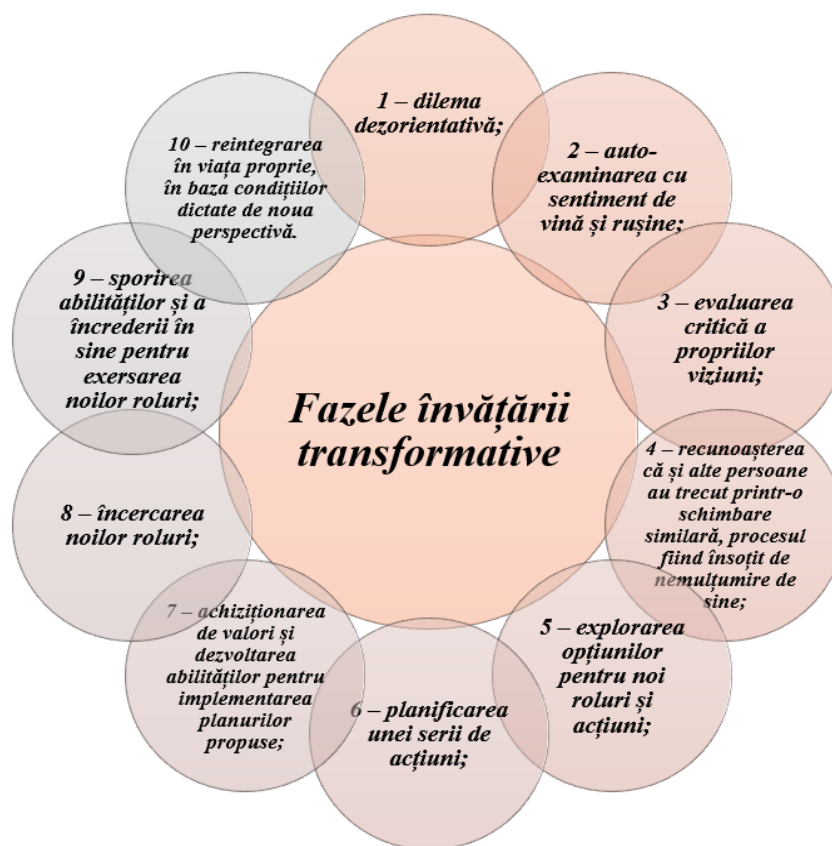
Figura 2. Fazele învățării transformative după Mezirow J. [17, p. 5]

La debutul cercetărilor sale, J. Mezirow identifică în anul 1978, nouă faze pe care formabilul trebuie să le parcurgă cu succes pentru a avea loc procesul de transformare și schimbarea viziunilor asupra lumii. Treisprezece ani mai târziu, în urma mai multor cercetări și discuții asupra pașilor propuși de către reprezentantul teoriei învățării transformative, acesta decide să mai includă o fază între stadiul 8 și 9. Astfel, până la momentul actual se operează cu toate cele 10 faze prezentate în fig. 2.